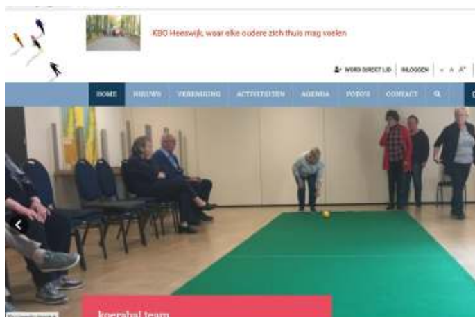
Een blik op de startpagina van de vernieuwde website